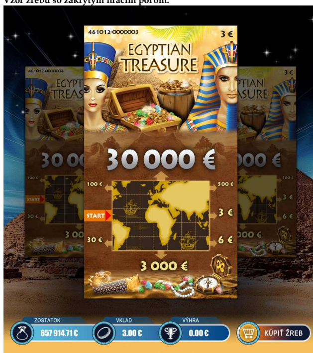
Vzor žrebu so zakrytým hracím poľom: