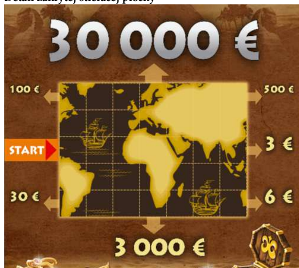
Detail zakrytej stieracej plochy