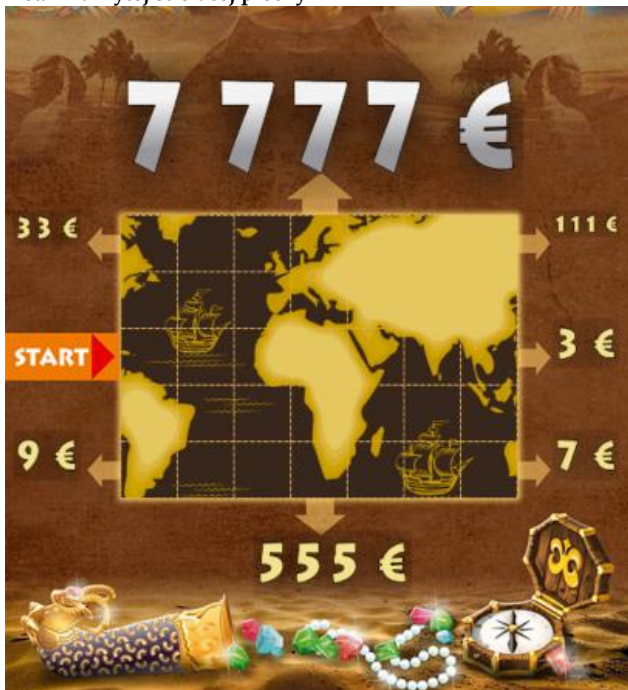
Detail zakrytej stieracej plochy