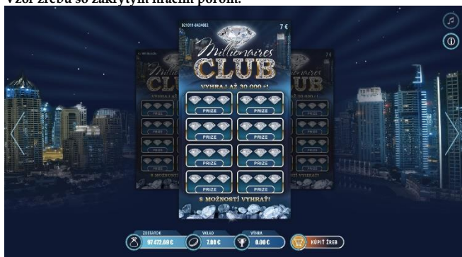
Vzor žrebu so zakrytým hracím poľom: