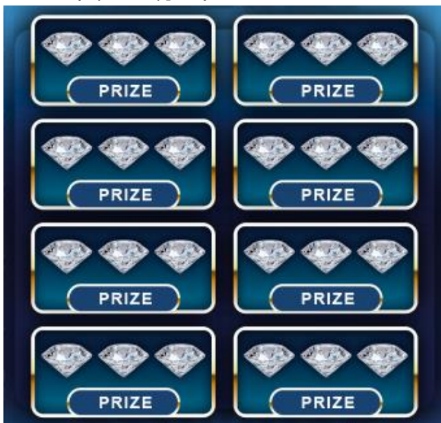
Detail zakrytej stieracej plochy